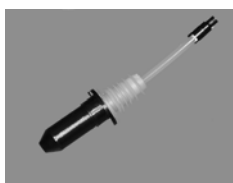
Bouchon de bouteille