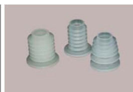
Adaptateur de bouteille